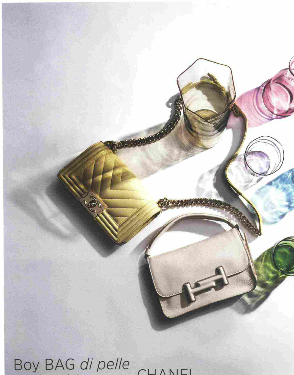
Boy BAG di pelle trapuntata CON CATENA, CHANEL. Borsa IN VITELLO con logo RIVESTITO di pelle, Tod's

CARAFFA ESAGONALE, VENNINI, COPERCHIO IN VETRO, INCIPT LAB (DA VISTORE DI JANNELL&VOLPI), BICCHIERI IN VETRO, ICHENDORF (DA CORRADO CORRADI)