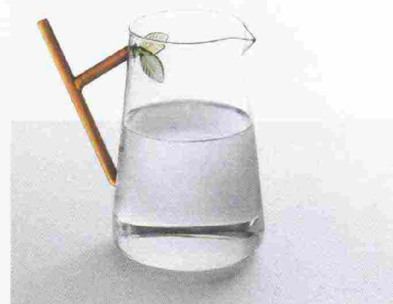
Bosco in tavola. La collezione Greenwood di Ichendorf, disegnata da Alessandra Baldereschi, prende spunto dalla natura e la riporta, in piccoli poetici dettagli, negli oggetti: bicchieri, teiere, tazze, oliere e brocche (foto, € 45), in vetro soffiato. ichendorfmilano.com

Romantico/moderno. Pennellate di colore come fiori stilizzati decorano i tovaglioli Nap Star di Society Limonta. In ramiè stampato, si acquistano anche separatamente. € 32 l'uno. societylimonta.com