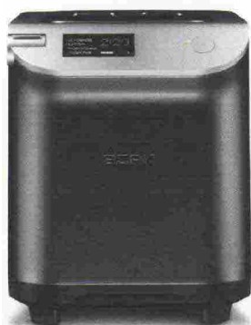
Un piccolo elettrodomestico con grandi potenzialità il toaster T 781 di Bork. Con display Lcd e motore silenzioso, ha 7 gradi di tostatura e 4 modalità automatiche: classica, burger con un solo lato tostato, defrost e riscaldamento. bork.com