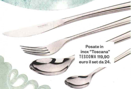
Posate in inox "Toscana" TESCOA 119,90 euro il set da 24.

Tra tovagliette di lino ricamate, piatti di vetro trasparente e piccoli decori pastello