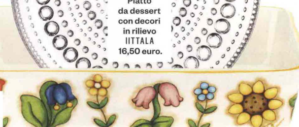
Teglia "Country" THUN 34,90 euro.