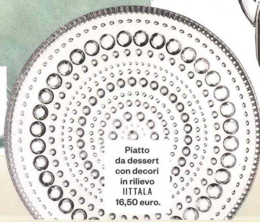
Piatto da dessert con decori in rilievo IITTALA 16,50 euro.