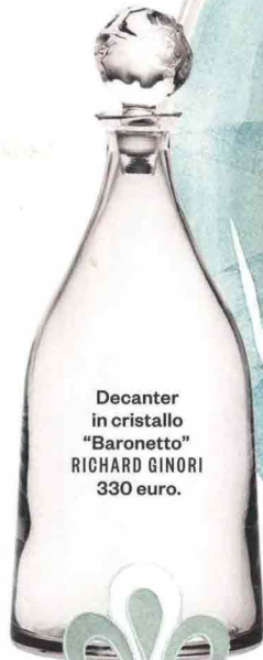
Decanter in cristallo "Baronetto" RICHARD GINORI 330 euro.