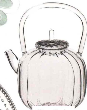
Teiera di vetro d'ispirazione giapponese ICHENDORF MILANO.