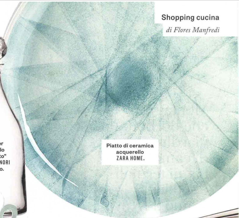
Piatto di ceramica acquerello ZARA HOME.