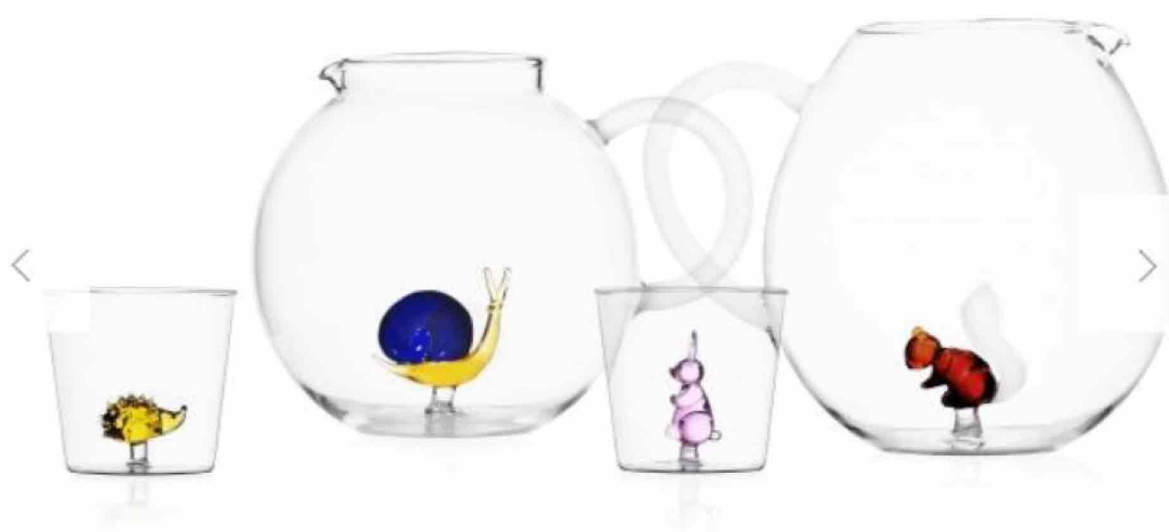
Animal Farm, ironica linea di bicchieri e caraffe disegnate da Alessandra Baldereschi per Ichendorf .