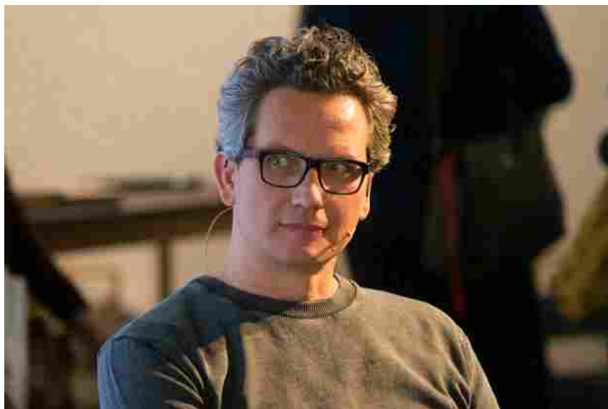
↑ Il designer Sebastian Bergne , curatore della Solutions Selection .

Nella Solutions Selection , esposta nel foyer del padiglione 4, il designer londinese Sebastian Bergne seleziona anche quest'anno gli utensili da cucina e le soluzioni intelligenti, capaci di determinare un upgrade in termini di funzionalità agli oggetti che fanno parte della nostra routine quotidiana. Sono, solo per citarne alcuni, spugne abrasive insensibili a funghi e batteri (Green Pioneer), posate sovrapponibili (Koziol), pirottini di carta realizzati con gusci di cacao (Fackelmann), barattoli per la fermentazione e la conservazione (The Rayware Group).