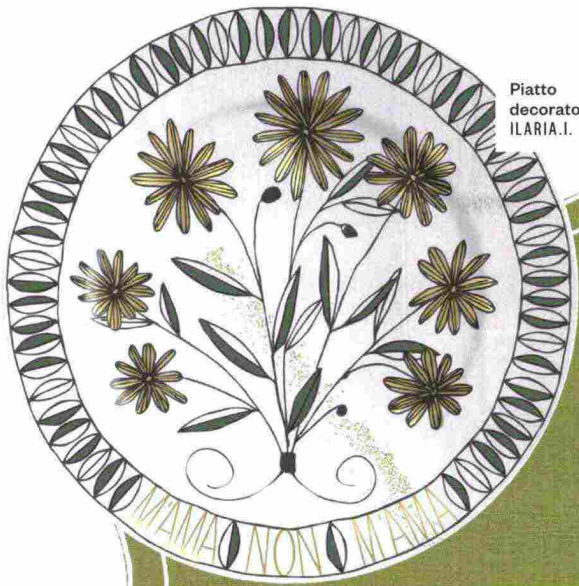
Piatto decorato ILARIA.I.