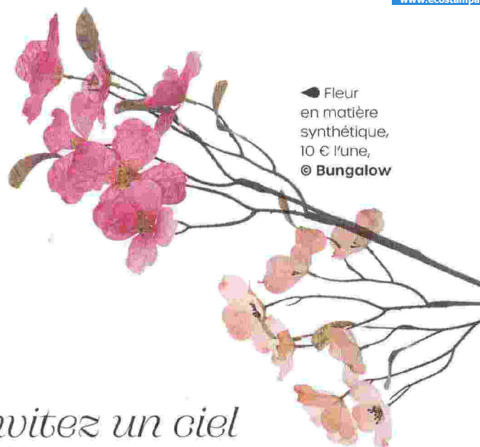
● Fleur en matière synthétique, 10 € l'une, © Bungalow